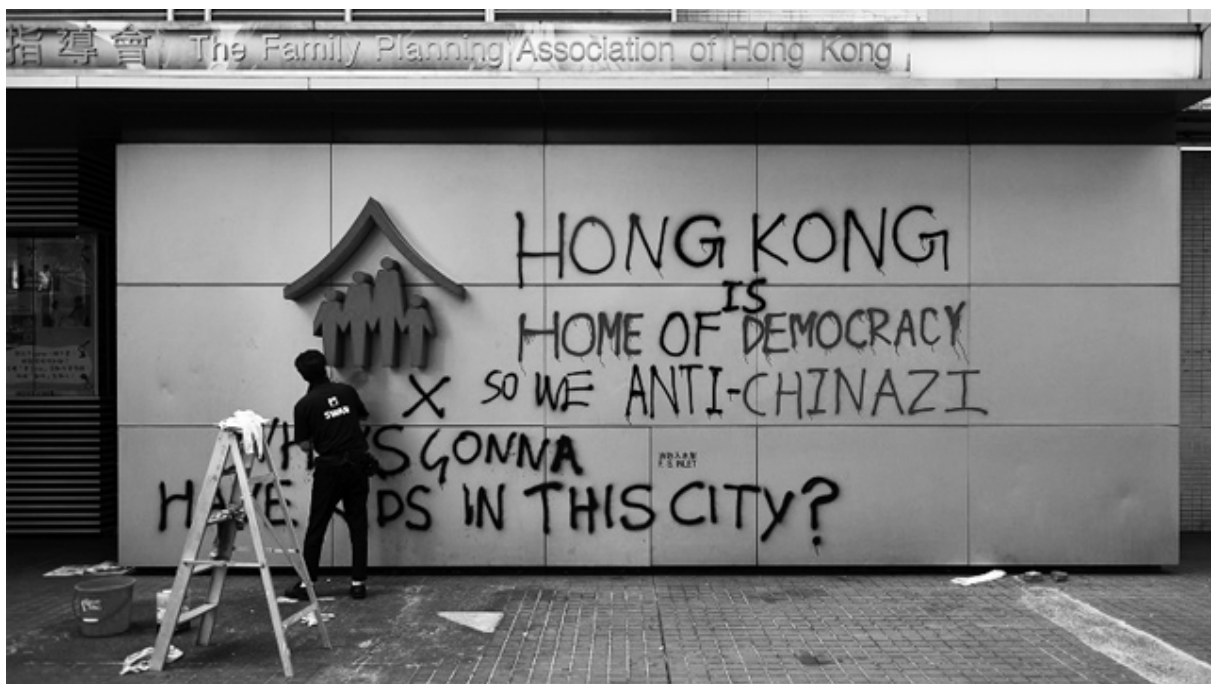
Hong Kong 2020

Det handlar inte om idéer, åsikter eller om alla rösta orange't, det handlar om vad vi gör med det vi har till hands . Det handlar om makten över att hantera och skapa livet som vi lever, så som vi vill att det ska vara. För närvarande är detta en enorm uppgift av historiska mått . Det vill säga något som absolut inte avgörs av några idéer , utan endast av praktisk och teoretisk handling .